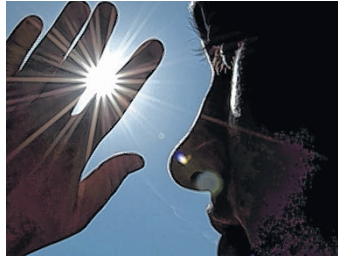
Die Zahl der jährlichen Hitzetage wird sich verdoppeln.