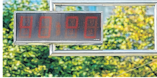
Die Zahl der Hitzetage (ab 30°) wird steigen. Im Oberland werden es 2050 zehn sein (bis 2011: 3).