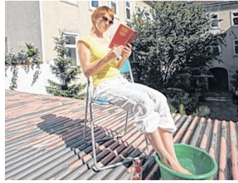
In den Städten ist es im Sommer heißer als am Land.