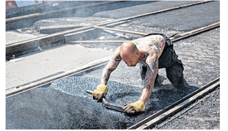
Die Arbeitsproduktivität nimmt mit der Hitze stetig ab.

Gesundheit: Bei einer moderaten Klimaerwärmung (bis zu 2° mehr) werden in einem durchschnittlich temperierten Jahr rund 1000 Menschen hitzebedingt sterben. Das begründet sich sowohl in der höheren Zahl an Hitzetagen als auch in der gestiegenen Zahl an älteren Menschen bis zum Jahr 2050.